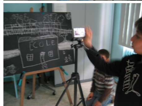
à gauche: poème composé par la classe de Mme Ermel ci-dessous: quelques prises de vue d'une animation